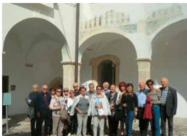
23. 9., na dvorišču gradu Rajhenburg