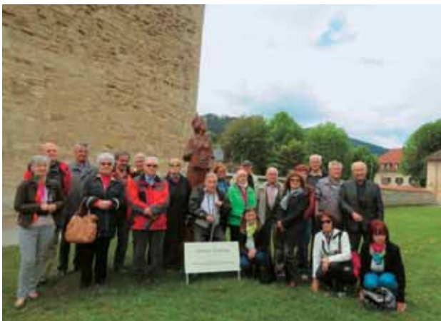
13. 5., Izlet na Krko, člani DSAP ob skulpturi sv. Heme, foto J. Lavrenčič