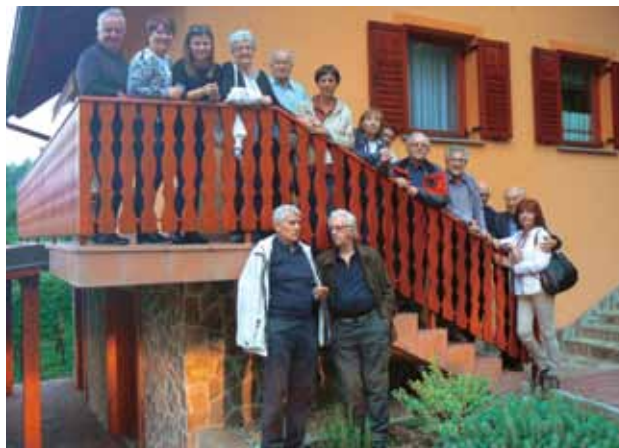
23. 9., Pred zidanico družine Pangerčič