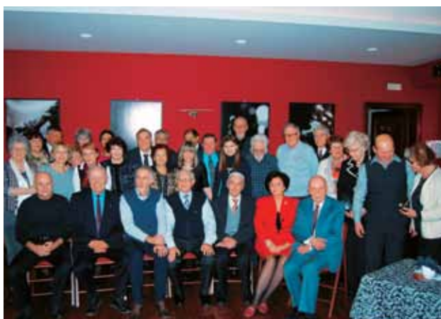
Srečanje članov DSAP, kavarna Slamič, december 2014