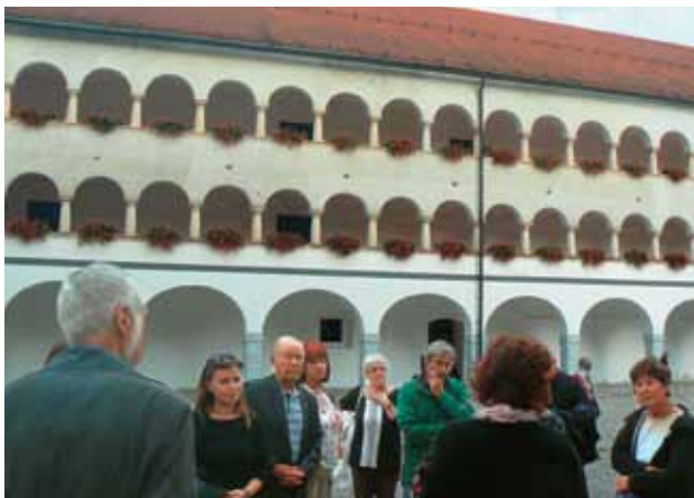
23. 9., Člani društva v Kostanjevici