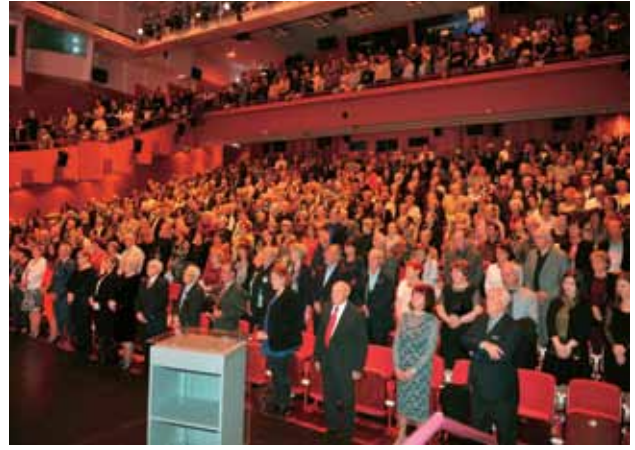
CD, 12. 4., Publika stoje poje Rož, Podjuna, Zila, foto Tofaj