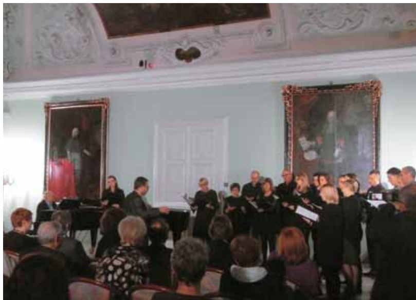
KULT Štajerske, Mariborski grad, 9. 10., nastopajoči pevski zbor in solisti