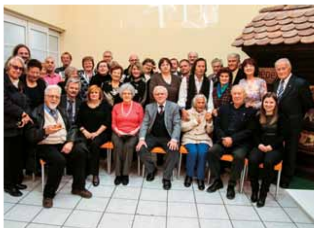
Medex, Srečanje članov društva in gostov, 8. 12. 2015