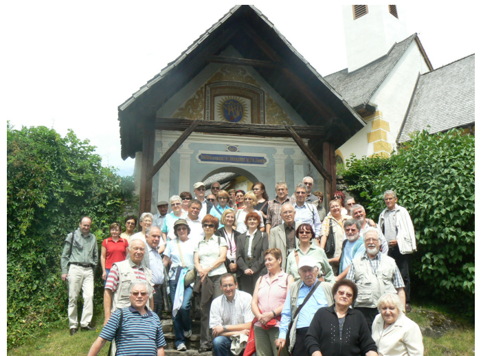
Vrbsko jezero, Otok / Maria Wörth