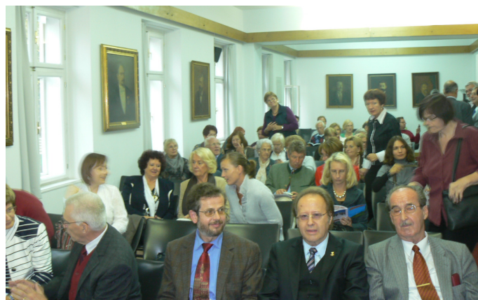
Predstavniki društev v Slov. matici