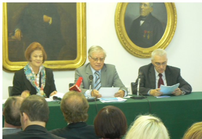
Predsedstvo Srečanja