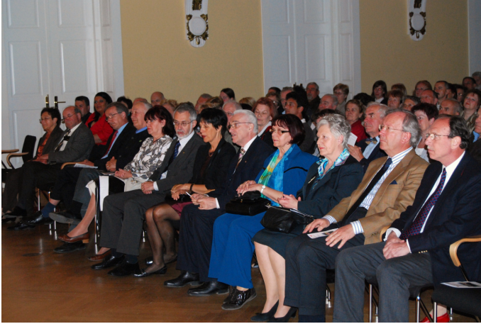
Koncert MePZ Sele, člani UO DSAP in častni gosti