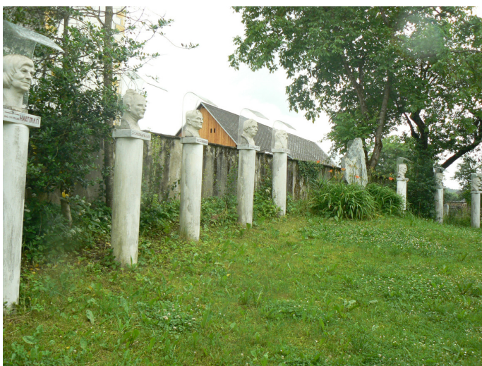
Gorštevov Vrt koroških kulturnikov, 19. 6. 10

pravica navsezadnje le zmagata. Žal ju mnogi ne doživijo in jim je priznana šele po smrti.» Kip – njegovo glavo, ki jo je seveda tudi sam naredil, so na podstavek posadili po njegovi smrti.