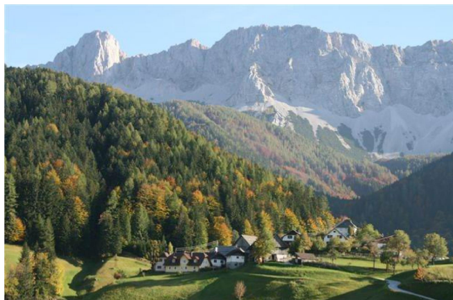
Vas Sele pod Košuto

OD 13. DO 20. APRILA 2010 V LJUBLJANI: na LJUBLJANSKEM GRADU, v ŠENTJAKOBSKEM GLEDALIŠČU, MINI TEATRU, FRANČIŠKANSKI CERKVI, SLOVENSKI MATICI in v UNIONSKI DVORANI GRAND HOTELA UNION www.dsap.si