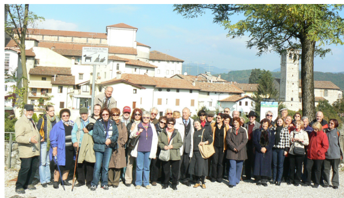
Čedad, 16. 10. 2010 vsi udeleženci