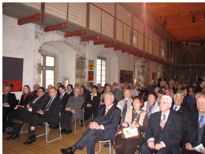
Častni gosti in publika na razstavi