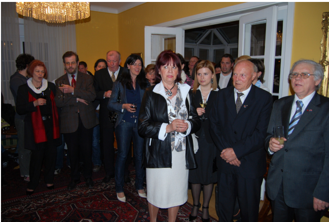
V rezidenci avstrijskega veleposlaništva smo po koncertu še vsi skupaj zapeli