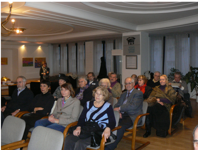
SSK, 26.3., predstavitev knjig, del poslušalcev