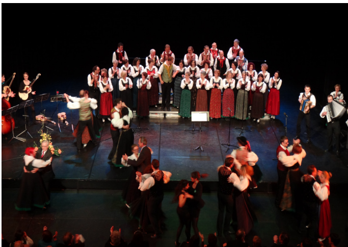
CD, 5. 4., MePZ Ojsternik, Nekateri smo tudi zaplesali.