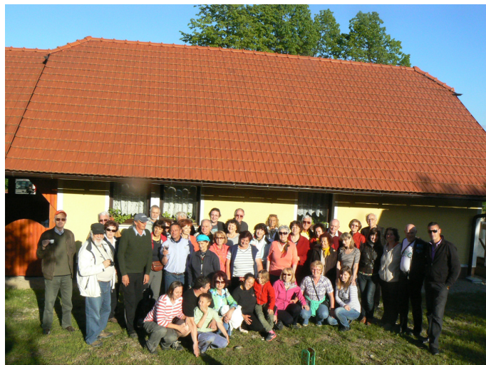
Člani društva na Tančem vrhu