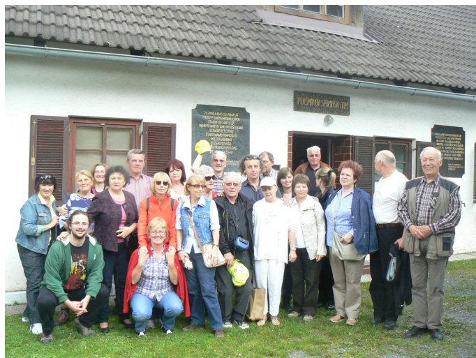
Člani društva pred Peršmanovim muzejem, 8. 6. 2013