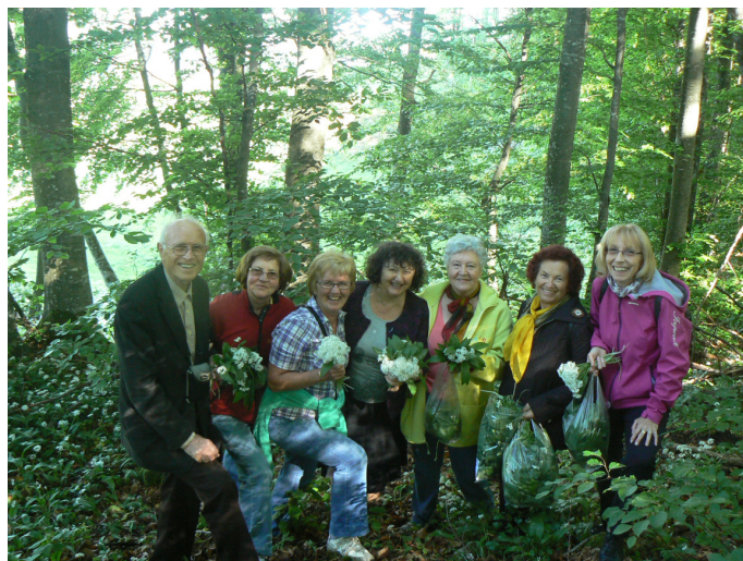
Tanči vrh, vesele nabiralke čemaža

Čas je mineval kot bi trenil in že je bil pred nami prelaz Strma Reber, ki nas po lepi, mestoma zelo strmi cesti, popelje navzdol do Osilnice in nato v prelepo dolino ob mejni reki Kolpi. Vse nas je nekoliko mučila ozka in vijugasta cesta, ki nas je vodila do mejnega prehoda s Hrvaško. Z olajšanjem smo obrnili na levo in se nato peljali po magistralni cesti do Kočevja, tam zavili v smeri proti Koprivniku in se končno ustavili pri družini Stanič na Tančem vrhu. Na ražnju pečeni jagenjčki, kokoši in doma pridelane povrtnine so nam ob požirku domačega žganja vzbudili apetit, čeravno nismo bili pretirano lačni. K veselemu vzdušju sta pripomogla tudi dva mlada harmonikarja, ki sta nas razvajala z narodnimi vižami. Med vožnjo proti domu smo imeli priložnost poslušati za uho in dušo prijetne melodije, ki jih je iz ustne harmonike izvabljal naš član. Sem ter tja se je ob spremljavi ustne harmonike zaslišala tudi blagozvočna slovenska pesem. Društven izlet smo zaključili pozno popoldne in se z lepimi vtisi razšli vsak proti svojemu domu.