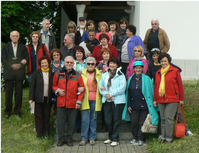
Pred cerkvijo J. Krstnika v Kočevski reki