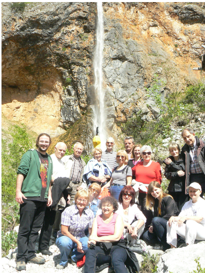
Člani društva pod slapom Rinke