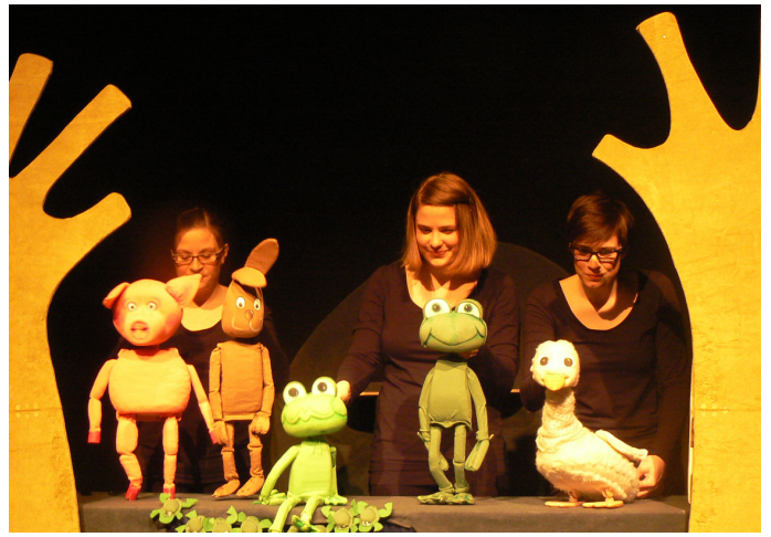
Mini teater, 6. 4., celovške lutkarice izvajajo predstavo ŽABE