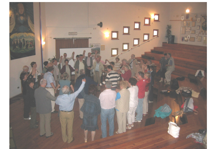
Udeleženci ekskurzije v Rezijo – skupna fotografija in med plesom v »Rozajanskem domu«

V tretje sem obiskala to prelepo gorsko dolino lansko leto – to pot s člani našega Društva. Že dlje časa je tlela v meni želja, da tudi našim ljudem omogočimo ogled Rezije, ki je name naredila izreden vtis že v prvih obiskih, ogled