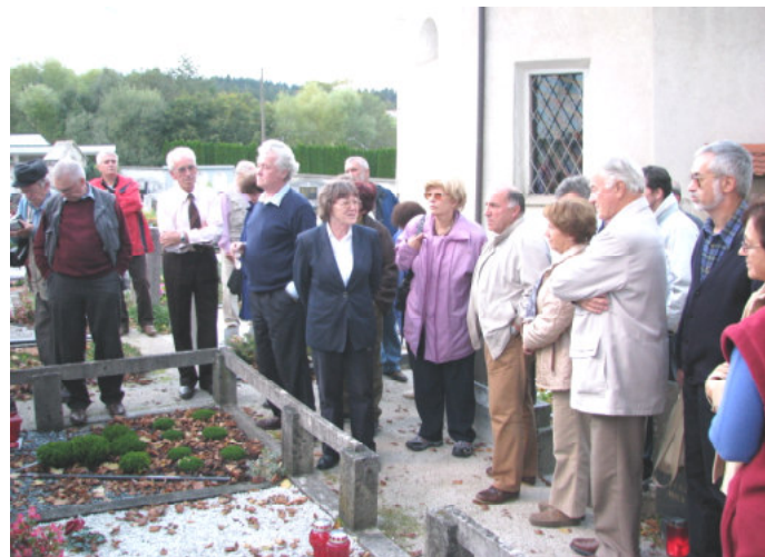
Ob Prežihovem grobu v Kotljah.

Njegovo literarno delo sicer deloma poznamo, toda po takšnih spodbudah človek zopet vzame v roke vsaj Samorastnike ali Solzice, če so mu dela, kot so Jamnica, Požganica, Doberdob, predebele.