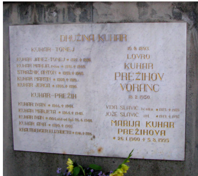
Nagrobnik Prežihu in družini v Kotljah.