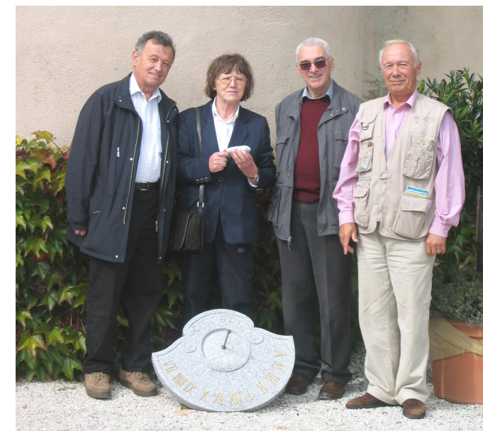
Generacije predsednikov DSAP

Seja Upravnega odbora Društva slovensko-avstrijskega prijateljstva – torek 22. januarja 2008. Med sklepi je tudi naloga, da ponovno natisnemo društveno glasilo »Srečno soсед«. Naslov, ki je sicer nekoliko podoben naslovu Avstrijsko-slovenske družbe v Celovcu – »Hallo Nachbar«. Nič ne de! Prebrali ga bodo lahko vsi, tisti, ki imajo internet in tisti, ki ga nimajo! Glasilo prinaša pregled dogajanja v letu 2007 in hkrati nekoliko programskih nalog in idej za letošnje leto. Žal nam je, da so društveni člani premalo aktivni, saj vse ideje, ki jih v glavnem skozi leto tudi realiziramo, prihajajo z delovne mize parih članov Upravnega odbora. Močno si želimo, da se naše članstvo pomladi, poizkusimo nagovoriti mlade najprej vsaj v domačem okolju. Vsekakor je delo lepo vpeljeno, postavljamo se lahko z odmevnimi prireditvami kot so »Koroški kulturni dnevi«, ki jih bomo v letošnjem aprilu izvedli že šestič, in z vrsto bogatih strokovnih poti in prireditev po sosednji Avstriji in Furlaniji-julijski krajini. Mnogo takih poti, prireditev in načrtov nam je še ostalo in zakaj ne bi tega z nami videli in uresničili tudi mlajši «novi» člani. Toplo jih vabimo v naše vrste!