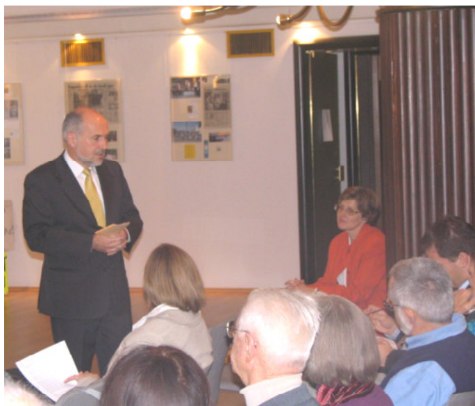
Nagovor dr. Valentina Inzka