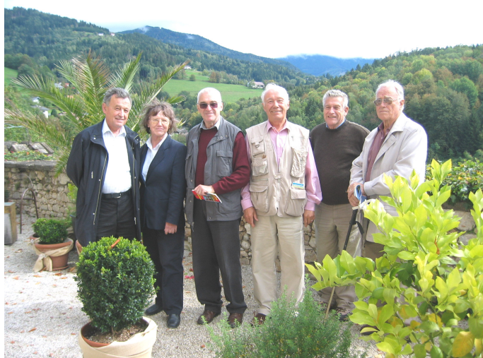
Udeleženci ekskurzije na gradu v Wolfsbergu.

Korak pa nam je zastal na hodniku ob knjižnici. Freska vesolja na stropu prostora je kazala, do kakšnih višin so segale vsebine starih knjig, ki so duhovno bogatile nekdanje menihe. Opazili smo lahko tudi, kako so bile po tematikah postavljene knjige v posameznih omarah. Nato pa smo še v baziliki občudovali predvsem fresko Tomaža Beljaškega.