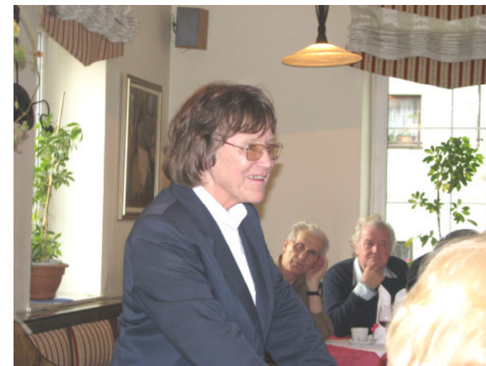
Nagovor podpredsednice v gostišču Rutar ob napovedi nastopa »Hudabivške Mete«.