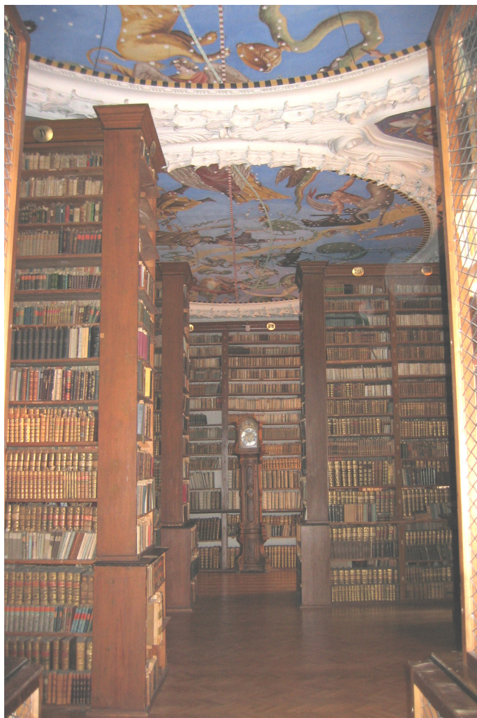
Dragocena duhovna dediščina samostanske knjižnice v Št. Pavlu.

Ko smo se napotili preko Ljubelja, po dolini Podjune vse do v Št. Pavla v Labotski dolini in na koncu do Prežihovih krajev v Sloveniji, smo se najprej ustavili v Št. Pavlu, kjer smo si v prostorih opatije ogledali razstavo del velikih evropskih mojstrov, od Dürerja preko Rembrandta, Leonarda da Vincija, Rubensa pa do štajerskega Kremser Schmidta. Kremser Schmidta imamo sicer tudi pri nas, za ostale mojstre pa je treba po svetu. Blizu naše meje nam je bila ponujena zbirka njihovih del. Užitek se je bil sprehoditi mimo njihovih mojstrov.